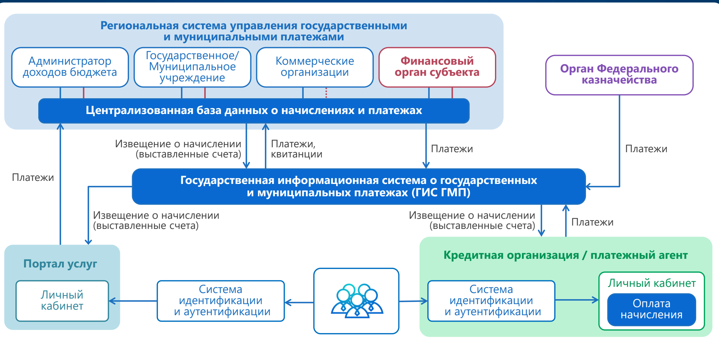
Схема взаимодействия с ГИС ГМП