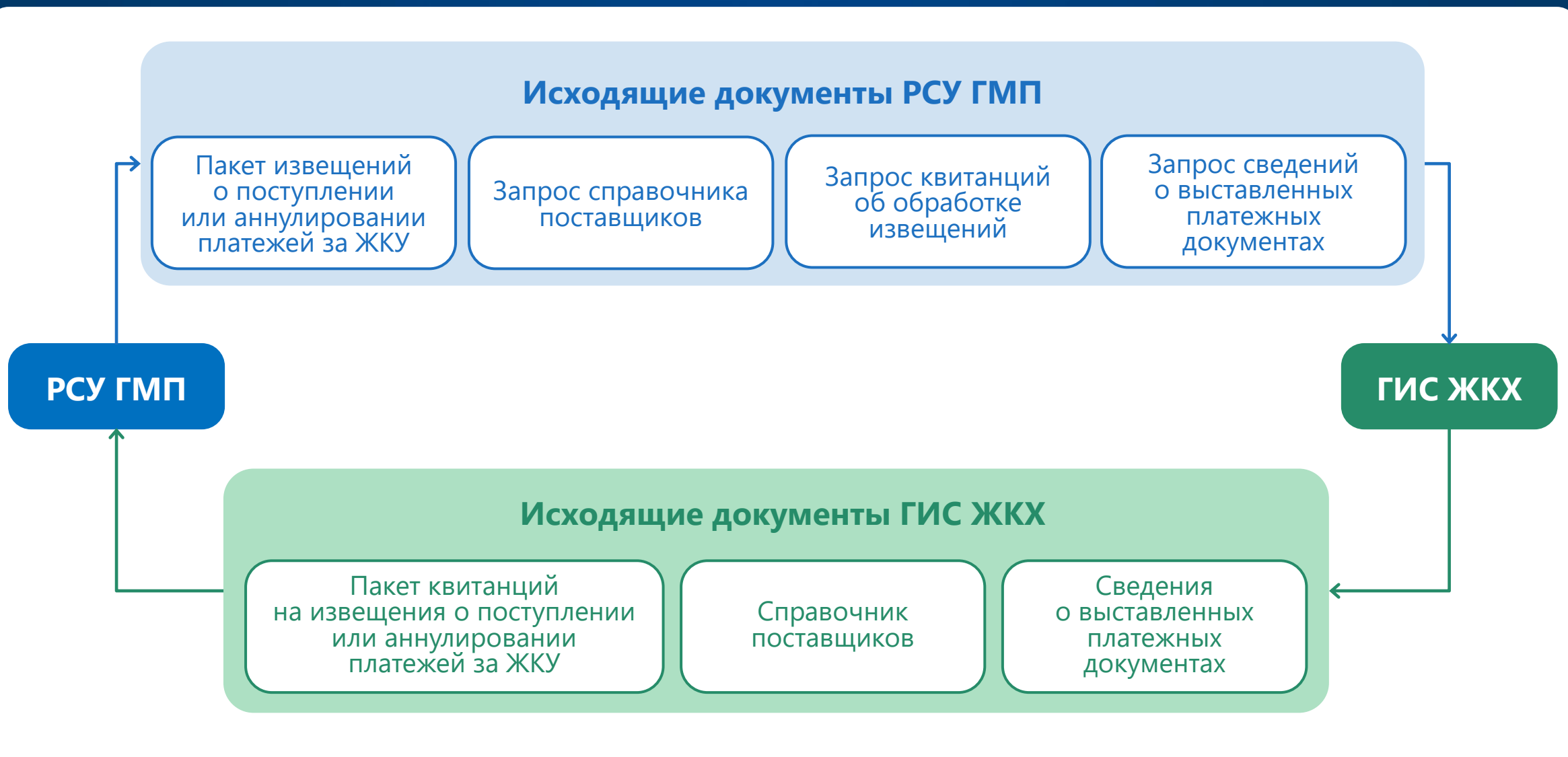
Схема взаимодействия РСУ ГМП с ГИС ЖКХ